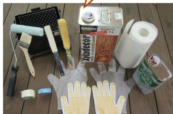
※ホームセンターで全部売ってます!