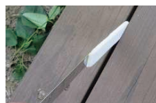
隙間を塗装するならこれ! こちらを先に塗りましょう