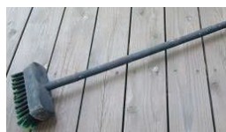
デッキブラシで水洗い! 十分に乾かして!