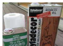
木部専用塗料 キシラデコール