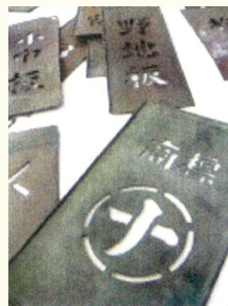
創業当時の文字盤