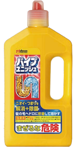
◎市販のパイプクリーナー

ところが、配管の掃除をやったことがないのでそのやり方が分からないという方がほとんどです。定期的なお手入れをすることで配管のつまりを予防できますので、ぜひ試してみてください。