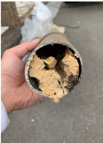
◎配管内に汚れが詰まってしまった状態

用意するものは、市販のパイプクリーナー。新築時からのお手入れであれば、パイプクリーナーを1か月に1回くらいの頻度でパイプの中に流し込んでください。汚れが固まってしまいう前に溶かすことが大事です。この時、最後に水を流す際は40～60度のお湯を多めに流しましょう。