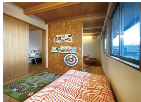
◎弊社展示場OHACOモデル OSB合板仕上げ

最近の長崎材木店の家は、住まれるご家族のライフスタイルの変動に伴って間仕切りができるように、最初から1部屋に2つドアを取り付けて建築したりしていますが、そういった家の作りではなくても、間仕切り壁を入れる場所を検討することで、今までの生活よりも便利な暮らしが出来たりもします。費用は壁の大きさや仕上げの材料によっても変動しますが、約15万円〜で工事可能となっております。まずはお気軽にご相談ください。