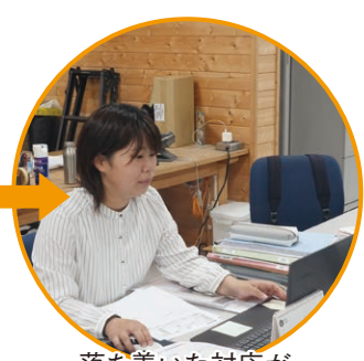
落ち着いた対応が非常に印象に残りました。“本日は、お疲れ様でした。”