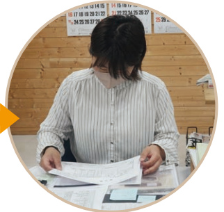
出社後、すぐに見積書等の書類のチェックです。