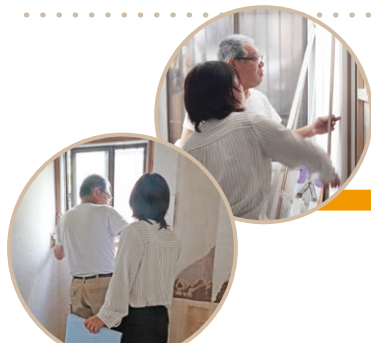
大工さんと問題点を話しながら、最善策を考えていました。