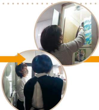
K様から他にも気になる箇所のご相談です。