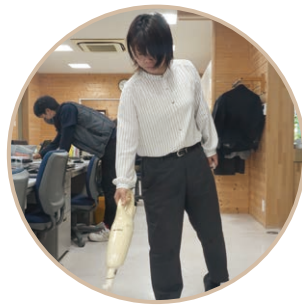
デスクワーク後、毎日事務所の掃除です。