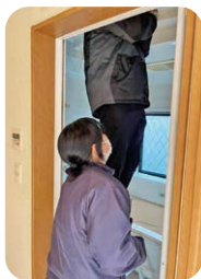
古賀市C様邸にメーカーと現地調査のためご訪問。